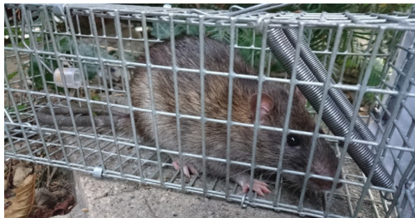
Figure 1 : Rat brun ( Rattus norvegicus ) capturé à Karlsplatz, Vienne, Autriche, dans un piège Manufrance.

Au total, 73 rats bruns ont été capturés (Figure 1). Parmi eux, 14 n'ont pas pu être analysés. Trente-six rats capturés à Karlsplatz (dont 18 étaient des mâles) et 26 capturés sur la promenade du canal du Danube (15 mâles) ont finalement été inclus dans l'étude.