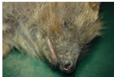
Figure 4 : Infestation d'un hérisson par Caparinia tripilis . Notez l'alopecie faciale squameuse et lichénifiée