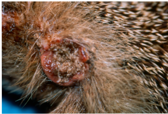
Figure 8 : Myiase cutanée surinfectée chez un hérisson