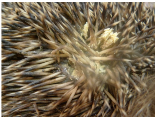
Figure 7 : Myiase cutanée chez un hérisson Notez la présence de paquets d'œufs de mouches au niveau des piquants

Les myiases sont relativement fréquentes chez les hérissons, aussi bien chez ceux souffrant de lésions cutanées que ceux ayant une peau intacte (Figure 7). Dans ce dernier cas, les larves de diptères sont retrouvées au niveau des orifices naturels (nez, yeux, oreilles, appareil génital femelle et anus). Par contre, lors de lésions cutanées, les myiases peuvent affecter n'importe quelle partie du corps du hérisson (Figure 8). L'effet pathogène de ces larves est variable, fonction de leur régime alimentaire et de la nature et de l'état du tissu atteint (nécrotique en surface ou tissu cutané vivant) (Robinson et Routh 1999).