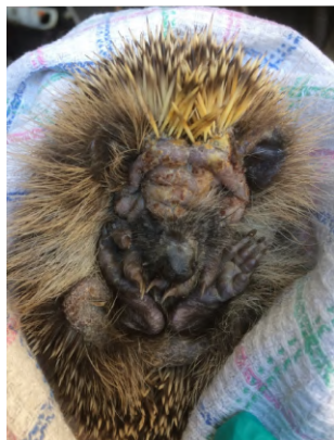
Figure 6 : Infestation d'un hérisson par Demodex erinacei . Notez l'hyperkératose et les lésions squamo-croûteuses étendues au niveau de la tête et de la région cervicale

Cet acarien est responsable de gales térébrantes, son cycle est homoxène. Après l'accouplement sur l'hôte, la femelle creuse des galeries dans la peau pour y pondre des œufs. Les hérissons galeux présentent un érythème cutané, un prurit, une lichénification, des croûtes, une alopecie et une perte de piquants (Pfäffle 2010). Les hérissons juvéniles peuvent développer une forme mortelle avec un érythème généralisé (Bexton et Robinson 2003). Enfin, la présence de lésions cutanées étendues favorisent les pyodermites secondaires (Arlian 1989).