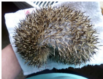
Figure 3 : Infestation d'un hérisson par Caparinia tripilis . Notez l'alopecie diffuse et squameuse étendue

Les infections causées par C. tripilis sont à l'origine d'un prurit, de larges zones alopéciques, d'un épaissement cutané et d'une perte de piquants (Gerson et Boever 1983 ; Kutzer 1992) (Figures 3-5). Cet acarien prédispose à une infection par les dermatophytes, notamment Trichophyton mentagrophytes var erinacei (Moreira et al. 2013), et à des myiases du fait de la présence de débris cutanés et de sérosités (Sweatman 1962 ; Brockie 1974 ; Bexton et Robinson 2003). Il existe le plus souvent un portage asymptomatique de C. tripilis par le hérisson (Brockie 1974).