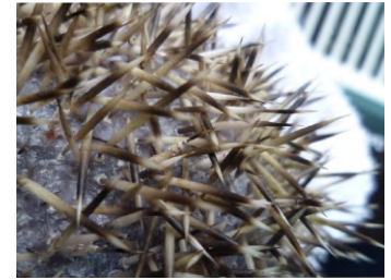
Figure 5 : Infestation d'un hérisson par Caparinia tripilis . Notez la présence de squames sur la peau et l'atrophie folliculaire lichénifiée des piquants