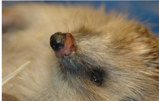
Figure 9 : Teigne surinfectée du chancre chez un hérisson provoquée par Trichophyton mentagrophytes

69 étaient porteurs d'agents de teigne. Trichophyton erinacei a été identifié dans 174 échantillons des 726 examinés (24%) et six prélèvements étaient identifiés comme Trichophyton mentagrophytes (Le Barzic et al. 2021).