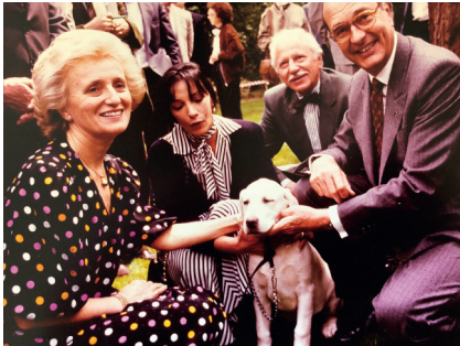
Michel Klein et un chien guide d'aveugle aux côtés de Jacques Chirac.

Pendant deux décennies il fut « Monsieur Animaux » à Europe 1 et collabora ensuite à de nombreuses publications dans les médias se rapportant aux problèmes des animaux.